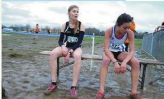
← Photo d'émotion : il faudrait recadrer légèrement la photo mais surtout la remettre à l'horizontale. Il est donc important d'être droit par rapport à la ligne d'horizon lors de la prise de vue pour éviter des photos penchées