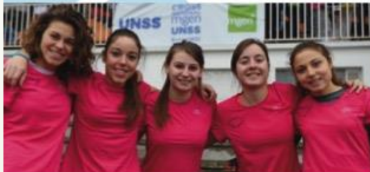
Bonne photo d'illustration de sportifs avec de la visibilité "UNSS" en arrière plan