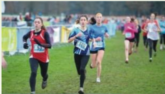
← Bonne photo d'action avec une belle profondeur de champ