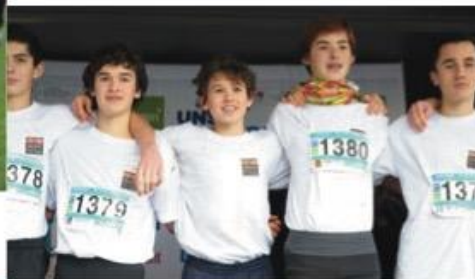
Photo de podium : le photographe s'est bien placé car il est en face des sportifs