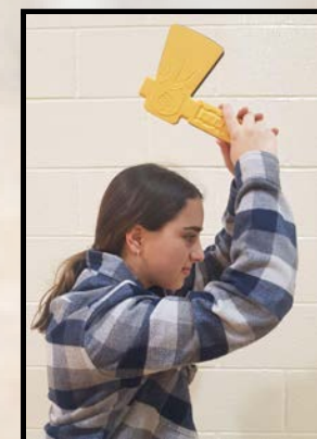
à deux mains